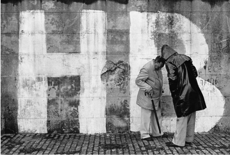
Fig. 2. Pintada con las siglas de HB a gran tamaño.

Fuente: Archivo Personal de Juntxu Rodríguez. Serie margen izquierda.