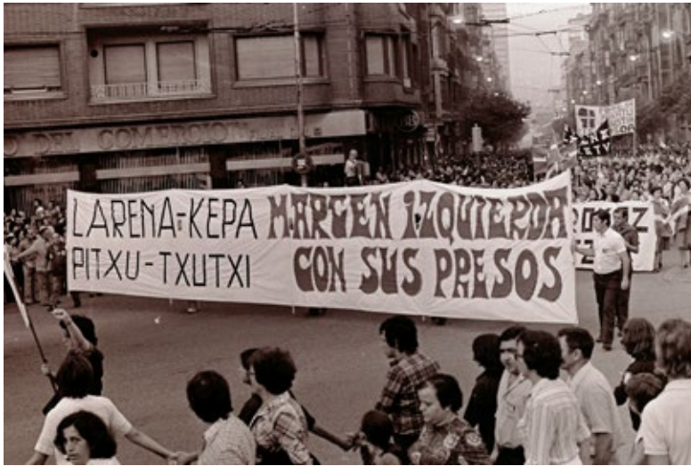
Fig. 4. Manifestación del nacionalismo vasco radical en los años de la transición, mostrando solidaridad con los presos de ETA de la margen izquierda. Bilbao, 1977.

mañana y tarde, en estas mismas poblaciones” 50 . Esta densidad de movilizaciones se reproducía con cada detención, salida de prisión, en las fiestas patronales, en días señalados del calendario mnemónico abertzale 51 , etc., ahondando en la hegemonía movilizadora del nacionalismo radical. El movimiento pacifista surgió a mediados de los ochenta, pero no discutió ese control de la calle hasta entrada la década de los noventa, cuando se puso en marcha la campaña por la liberación de los secuestrados por ETA. 52