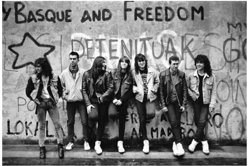
Fig. 1. Un grupo de jóvenes con estética heavy posa ante un muro en el que se reclama la “libertad” de detenidos.

Chapnik: “los fotógrafos son nómadas; su territorio es el mundo” 15 . En sus trabajos sobre el Bronx mostró llamativas concomitancias con la zona de la ría de Bilbao que le era tan familiar: los yonquis, las ruinas urbanas y, pese a todo, el flujo constante de la vida cotidiana en los mercados o en las calles.