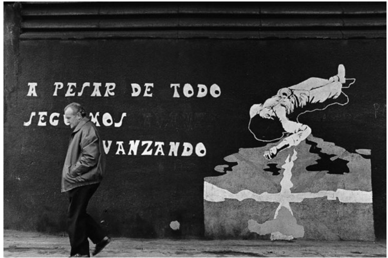
Fig. 3. En la pintada puede leerse: “A pesar de todo, seguimos avanzando”, junto a un “mártir” caído sobre un charco de sangre que representa la ikurriña.